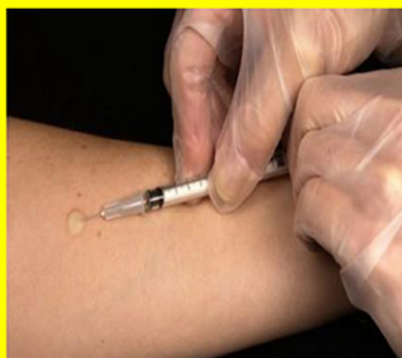
TEST CUTANAT LA TUBERCULINA -la copii